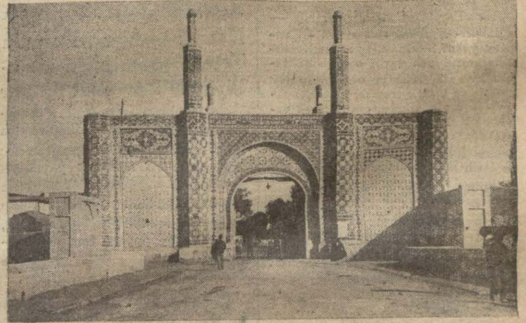
Şahranın başlıca giriş kapısından biri

İran Şehinşahi Pehlevî Hazretlerinin memleketimizi ziyaretleri münasebetile İran okuyucularımıza tanıtmak için neşretmekte olduğumuz yazı silsilesi bugünkü ile nihayete eriyor. Umumi olmakla beraber, bu yazılar, nihayet komşu ve dost memleket hakkında bir fikir edinilmesini temin etmektedir. Her öğreniş biraz daha yakınlığı temin edeceği için bu yazılarımızın her iki memleketi bir parça daha yaklaştırmaya hizmet edeceğinden emin bulunuyoruz.