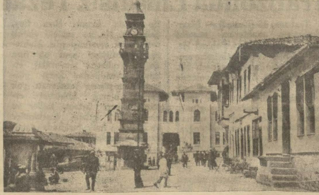
Yozgatta Muhasebe Hususigenin 70 bin liraya yaptırdığı yeni hükümet binası

Yozgat, (Hususî) — Hususî muhasebe bütçesi 400 bin lira olarak kabul edilmiştir. Hususî muhasebede 32 bin lira sermaye ile bir de İktisat ve tasarruf sandığı tesis edilmiştir. Sandık köylüye ve memurine para ikraz etmektedir. Yeşilova kazası hükümet doktoru vilâyet sandığının 800 liralık muavenetile Avrupaya tahsile gönderilmiştir.