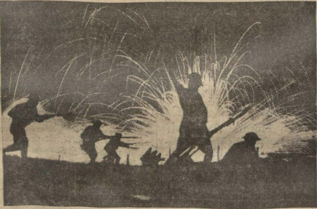
İnsanlar, böyle bir akıbeta düşmemiğe çalışıyorlar

Bu Çapraşık Meseleler Bizi Ya Rahata, Yahut Görülmemiş Müthiş Bir Akıbeta Sürükleyecek